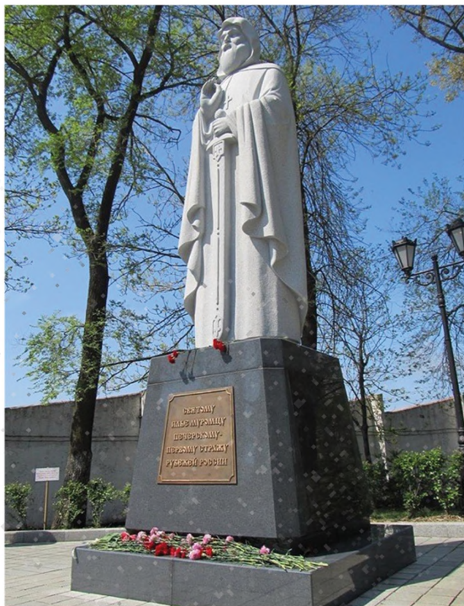
Памятник Илье Муромцу во Владивостоке

На Руси в этот зимний Ильин день старались не заниматься